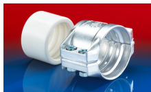
CONNECT SAFETY CLAMP ASSEMBLY 231