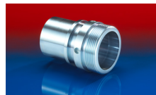
CONNECT THREAD FITTING 234