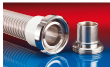
CONNECT MOULD ASSEMBLY 233