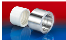
CONNECT PRESS ASSEMBLY 232